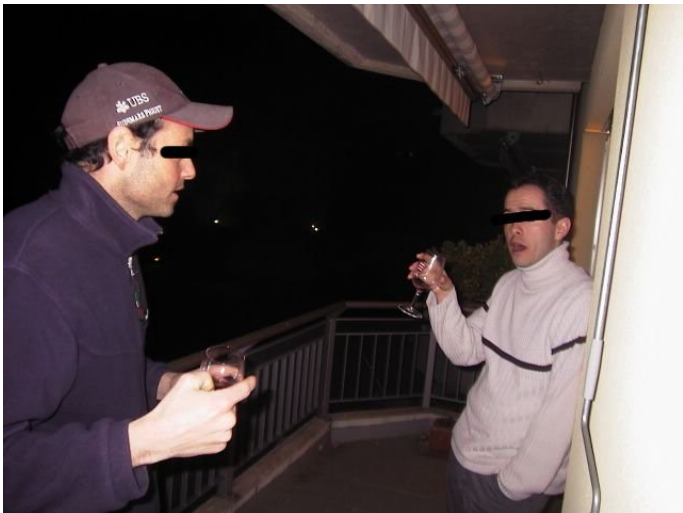
TERRIBLE AVEU: "je ne me sentais bien que lorsque j'étais saoul"

Lorsqu'il décide d'arrêter, Docteur B passe par une période très difficile. Il sombre dans l'alcoolisme et dépense tout son argent au poker: "je ne me sentais bien que lorsque j'étais saoul".