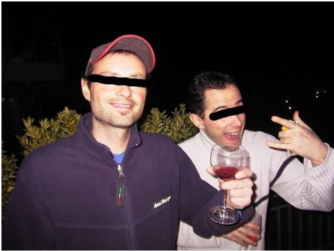
TÉMOIGNAGE ÉDIFIANT: "cela me donnait l'impression d'être plus intelligent"