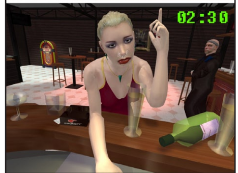
SCANDALE: les photos compromettantes parlent d'elles-mêmes