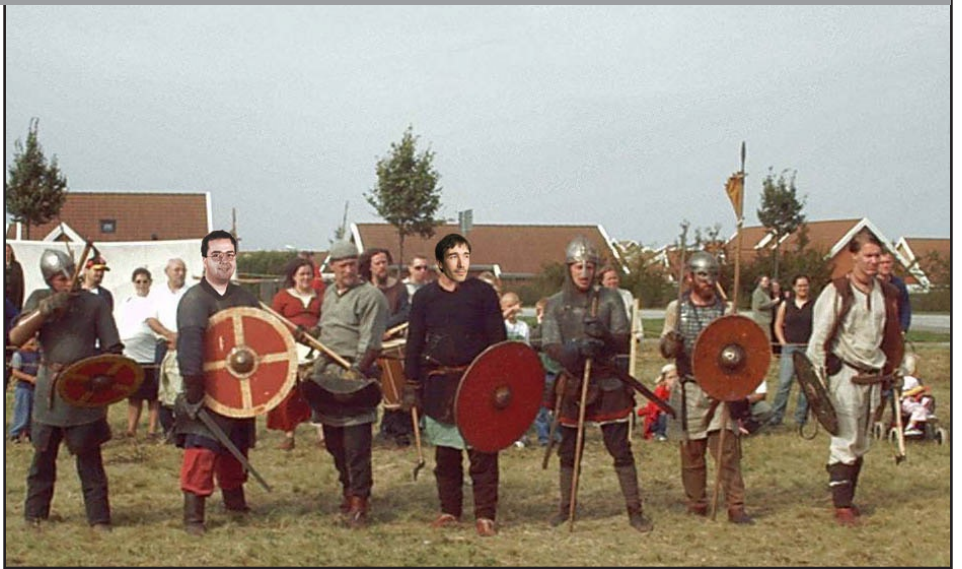
SOLENNELS les membres de notre équipe au grand complet (photo prise avant l'annonce du transfert du siècle).

Avec des statistiques impressionnantes et notamment 231.4 buts marqués des cornes et plus de 957 tacles avec arrachage, le joueur emblématique du club aura de toute évidence aucune difficulté pour s'acclimater à ce nouveau championnat. En attendant de le revoir en ligue des barbares, nous suivrons évidemment la suite de sa carrière avec beaucoup d'intérêt.