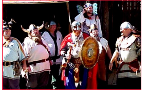
CERVEAUX DU NORD: le Doyen Fåipåssønåge (au centre) et le steering board de l'Université de Aållbørgst