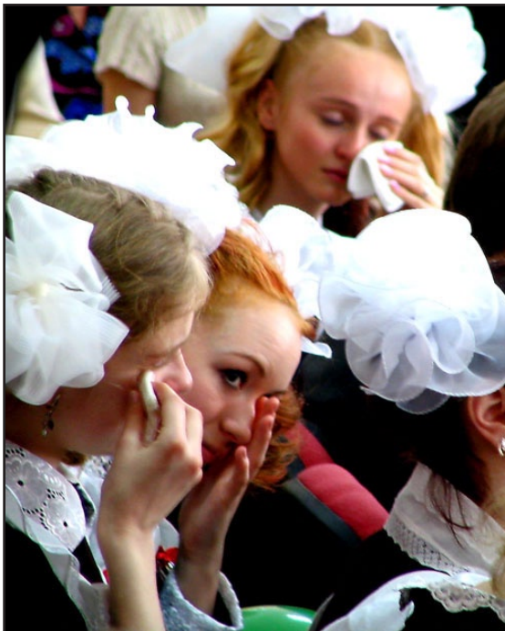
DÉSESPOIR la tristesse se lit sur les visages des fans de No(no).